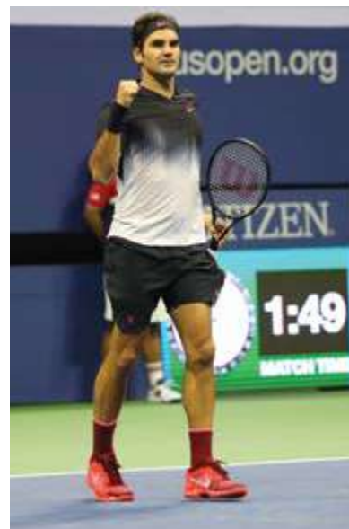
Jucătorul de tenis Roger Federer, câștigător a peste 100 de trofee

● Perseverența, experiența, rezistența la eșec și încrederea în sine sunt trăsături de bază ale oamenilor de succes. Ei dovedesc tenacitate în ariile lor de interes și cred cu tărie în atingeră țelurilor!