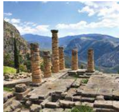
Templul lui Apollo din Delphi

În Antichitate, oamenii din Europa călătoreau în Grecia pentru a vizita Oracolul din Delphi, în căutare de sfaturi pentru problemele care îi frământau: dragoste, război, comerț etc.