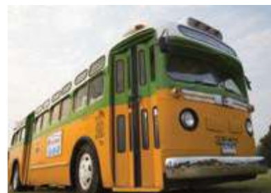
Autobuzul în care Rosa Parks s-a așezat pe scaun, expus la Washington, D.C., National Mall

Rosa Parks a fost prima femeie de culoare care a îndrăznit să refuze cedarea locului unui alb. Deși arestată, suferința ei a schimbat lumea, făcându-i pe liderii comunității de culoare să acționeze pentru eliminarea legilor discriminatorii.