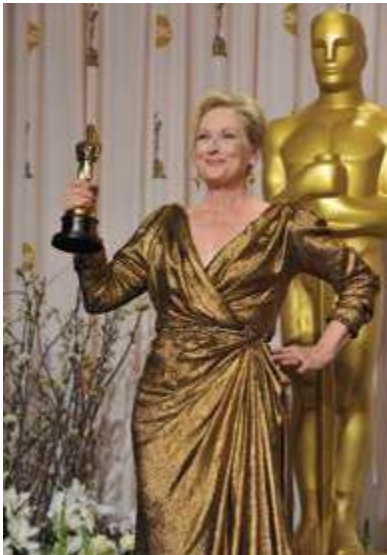
Actrița Meryl Streep, triplu laureată a Premiului Oscar